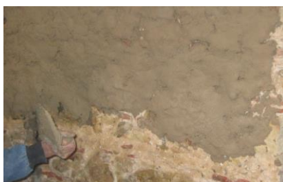
Aplicação manual da argamassa