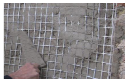
Colocação da rede na camada ainda fresca

Em máquinas sem doseamento automático de água amassar o REABILITA Cal Consolidação , na proporção de 3,0 a 3,5 litros de água por saco de 25 kg para a obtenção da consistência adequada para a realização da consolidação e encasque. Caso de pretenda a execução do chapisco o REABILITA Cal Consolidação deve ser amassado na proporção de 6,5 a 7,0 litros por cada saco de 25 kg.