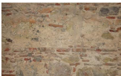
Preparação do suporte